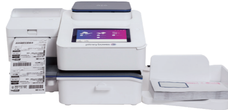
SendPro® C 220+ / SendPro® C 320+