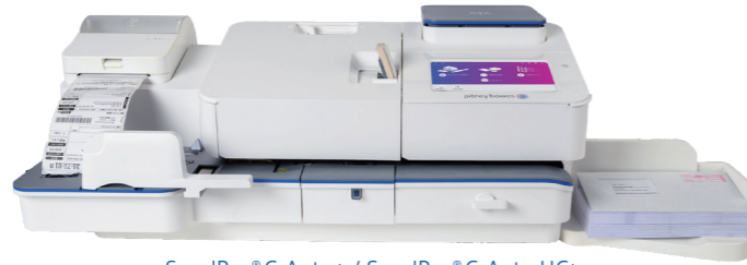
SendPro® C Auto+ / SendPro® C Auto HC+